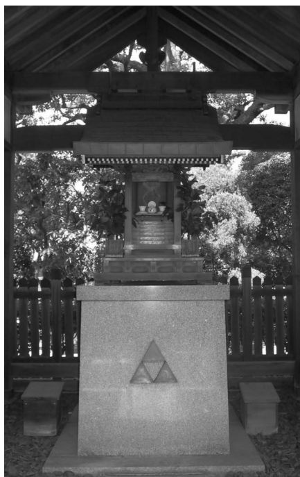
松下電器本社の一隅にある白龍大明神を祀ったお社。龍神の印、三鱗 みつうろこ 紋が刻まれている

昭和九年までは白龍大明神だけであったが、事業部制や分社制が敷かれてから、昭和十年、松下電工に黒龍大明神、同十一年、松下電器電極工場に青龍大明神、自転車工場に赤龍大明神、豊崎工場に黄龍大明神が初めて祀られた。